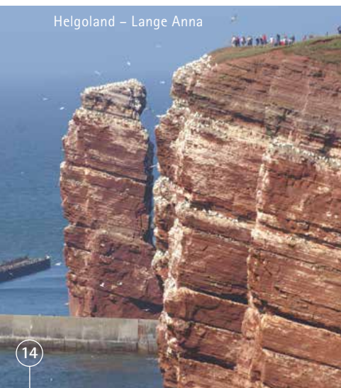
Helgoland – Lange Anna

Sie lieben Wasser? Dann sind Sie in Hamburg, der Stadt mit mehr Brücken als Venedig, genau richtig. Bei einer Rundfahrt lehnen Sie sich entspannt zurück und erleben die Highlights aus nächster Nähe: Den Michel, die Binnen- & Außenalster, die „sündige Meile“ Reeperbahn, den Hafen und das „neue Wahrzeichen“ der Stadt, die Elbphilharmonie. Am Nachmittag der Blick aus der Seemanns-Perspektive – die Hamburger Barkasse zur Hafensrundfahrt wartet schon auf Sie. Wie wäre es zudem am Abend mit einem Musical-Besuch, z. B. Disneys „König der Löwen“?