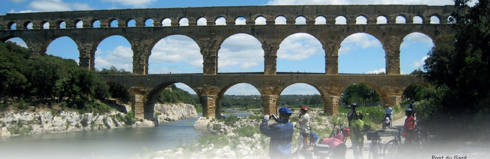
Pont du Gard